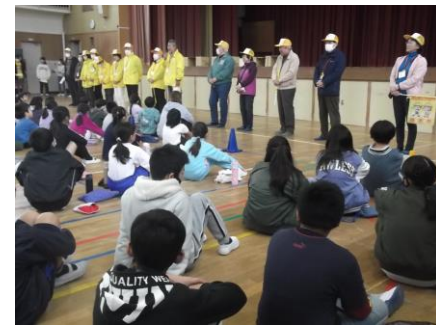
見守り隊お礼の会(2・20)