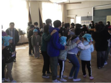
新1年生 体験入学 (5年生と交流)