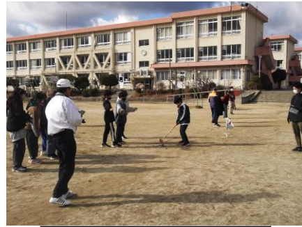
地域の方と交流(6年生)