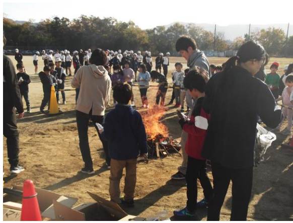
校庭でやきいも（1・2年生）