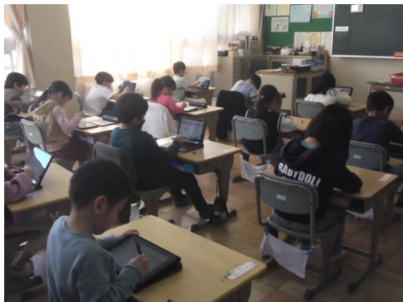
タブレット学習（1年生）