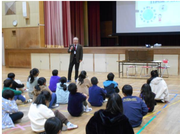
非行防止教室（5年生）