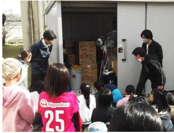
社会科 地域防災の学習（4年生）