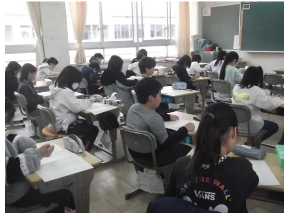
とよのチャレンジ（全学年）