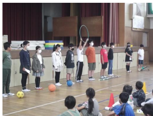
児童朝会 (体育委員会の発表)