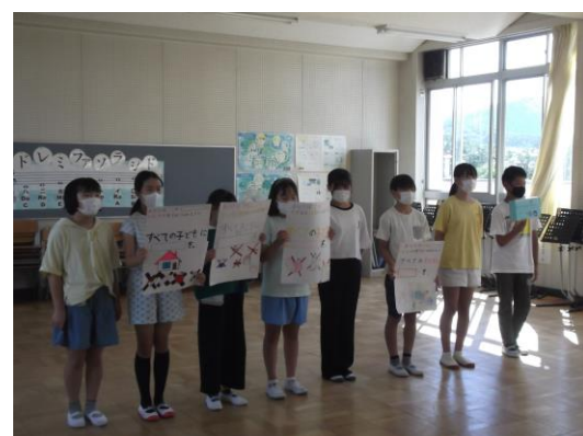
スクールカウンセラーによる『心の授業』