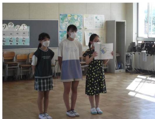
スクールカウンセラーによる『心の授業』