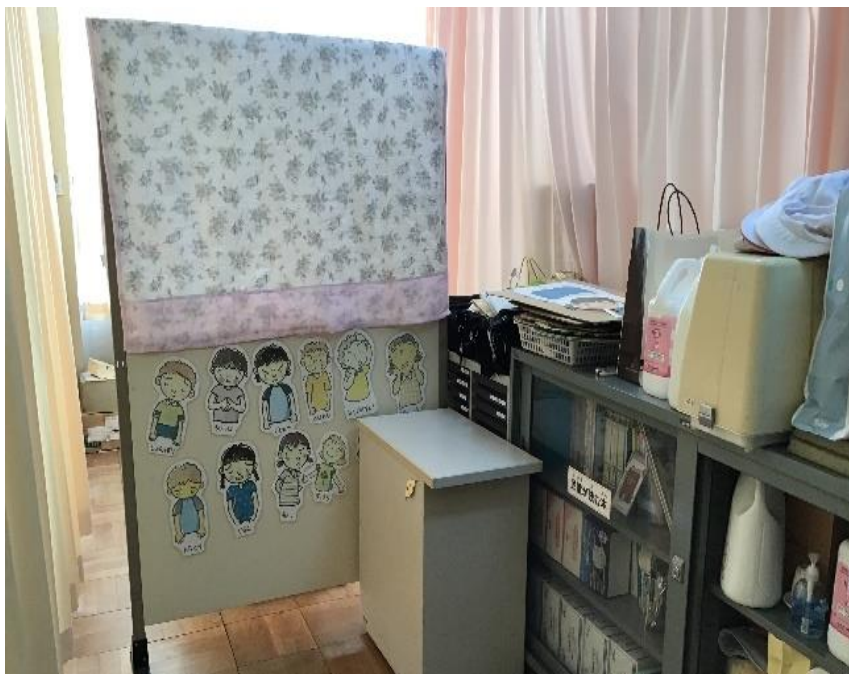
①ここで服をぬぎます。