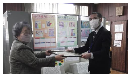
大阪府人権擁護委員連合会より 「人権の花運動」感謝状をいただきました