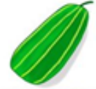
玉造黒門超瓜 (たまつくりくろもんしろり)