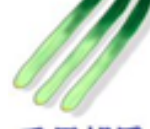
毛馬胡瓜 (けまきゅうり)