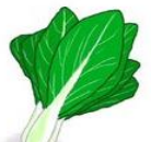
大阪しろな (おおさかしろな)