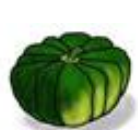
勝間南瓜 (かつまなんきん)