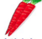
金時人参 (きんときにんじん)