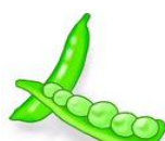
碓井豌豆 (うすいえんどう)