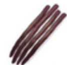
高山牛蒡 (たかやまごぼう)