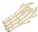
三島独活 (みしまうど)