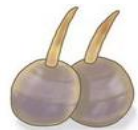
吹田慈姑 (すいたくわい)