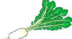
田辺大根 (たなべだいこん)