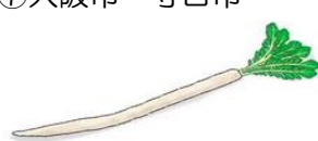
守口大根 (もりぐちだいこん)