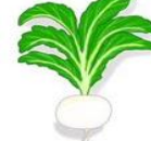
天王寺蕪 (てんのうじかぶら)