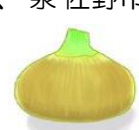
泉州黄玉葱 (せんしゅうきたまねぎ)