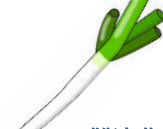
難波葱 (なんばねぎ)