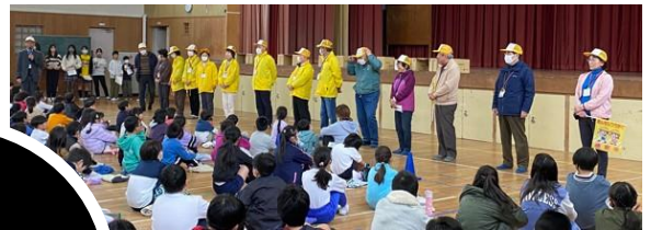
児童会による見守り隊お礼の会