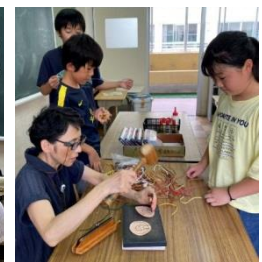
革コースター作り