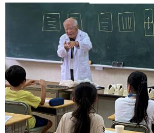
偏光板万華鏡作り