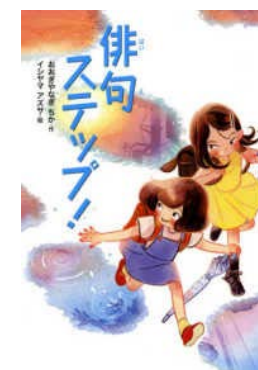
はいく 俳句ステップ!