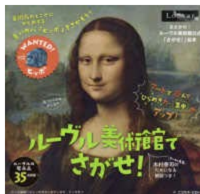
びじゅつかん ルーブル美術館で