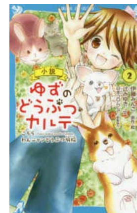
しょうせつ 小説 ゆずのどうぶつ カルテ ② ③巻