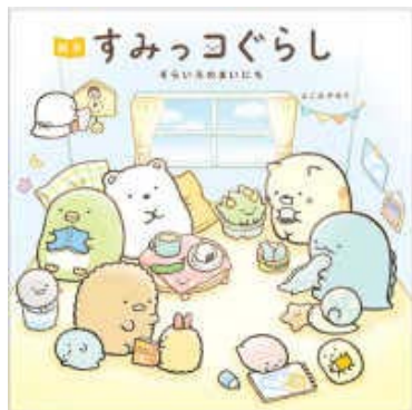
えほん 絵本すみっコぐらし —そらいろのまいにち—