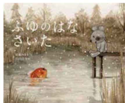
ふゆのはな さいた