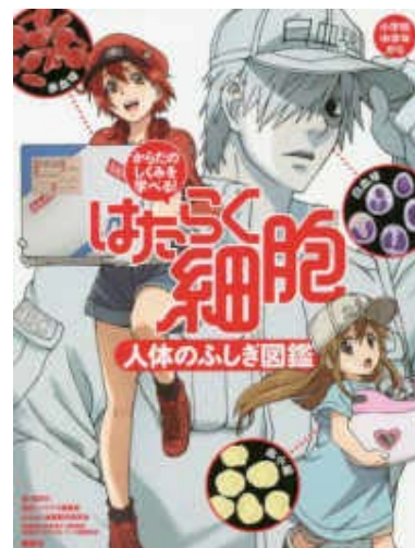
さいぼう はたらく細胞 じんたい 人体のふしぎ図鑑