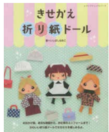
きせかえ 折り紙ドール お 折り紙好きさん、 チャレンジしてみてね♪