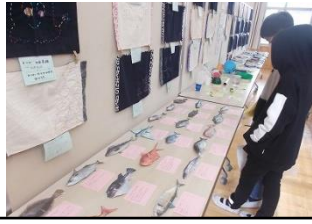
中学生の作品に見ている小学生

13日（火）から16日（金）の期末個人懇談の日程に合わせて、1学期から取り組んできた児童生徒たちの研究や作品を一挙に公開しました。ネットや図書を駆使して調べ上げたレポート、道具と確答しながら作り上げた図工や美術作品、思わずクスッと笑ってしまう詩など、保護者の方々にも子どもたちの頑張りをご覧いただきました。世界あちらこちらの民族衣装や生活用具などを集めた職員出展による“ひがしのせみんぱく”もありました。