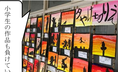
小学生の作品も負けていません