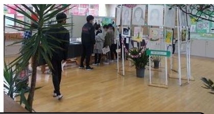
世界のお面、楽器 etc まさに民博です