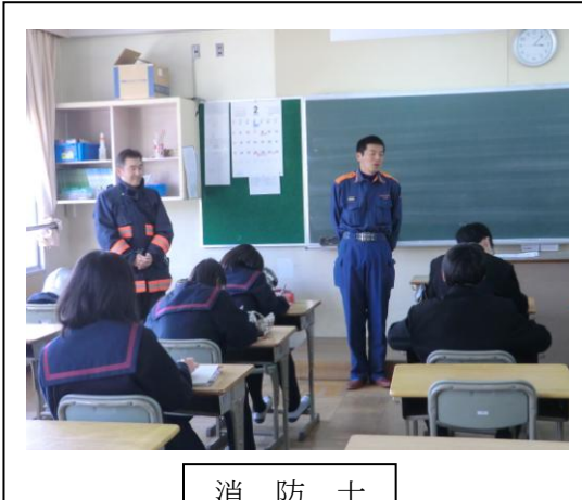
消 防 士

英会話学校に通い勉強しています。先日1年生の「仕事発見」の授業の講師の方も、最近の企業の入社の条件に、TOEFL OR TOEIC(英語によるコミュニケーション能力を評価する世界共通のテスト)がある点数以上を条件にしていますと話されていました。もう一つは、人間力を鍛えるための勉強です。もとはといえ