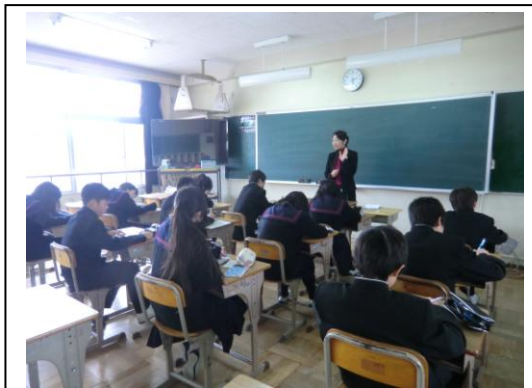
元キャビンアテンダント

一方勉強には、二つの方向性があります。一つは、人生を生き抜くための道具・武器としての勉強です。仕事に就いても、様々な資格の取得が必要であり、今後更に進むグローバル社会では、会話は英語が基本といわれます。多くの社会人は仕事を終えてから、自主的に