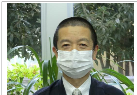
人に対してエチケットマスクを！！

マスコミの情報によりますと、1月下旬から2月初旬にインフルエンザ流行のピークを迎えるようです。本校をはじめ豊能町ではまだ大きな流行はありません。だからといって安心することができません。まずは日常生活での予防が大切です。①体調を整えて抵抗力をつけ、ウイルスに接触しないことが大切です。②インフルエンザウイルスは湿度に非常に弱いので、室内を加湿器などを使って適度な湿度に保つことは有効な予防方法です。③ウイルスを近づけない為に、できる限り人込みは避ける。④外出後、手洗いとうがいを！手洗いは接触による感染防止、うがいはのどの乾燥防止。⑤マスク着用。咳やくしゃみからの飛沫防止。『人に対して』という意味で『エチケットマスク』などといわれます。人が多く集まる場所や、通勤通学時にマスクをしている人が多くなっています。