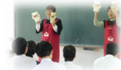
事前学習のようす

11月8日（水）に3年生が保育体験学習を行いました。校区内にある吉川保育所とひかり幼稚園を訪れ、就学前の子どもと触れ合う学習を行いました。とよの絵本の会「とまと」の方に、読み聞かせについて教えていただき、訪問当日は、どの生徒もしっかりと読み聞かせをしていました。