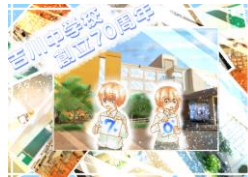
70周年記念 クリアファイル

保護者の皆様におかれましても、一人ひとりの成長を認め評価してやっていただければと思います。13日からの期末懇談よろしくお願ひします。