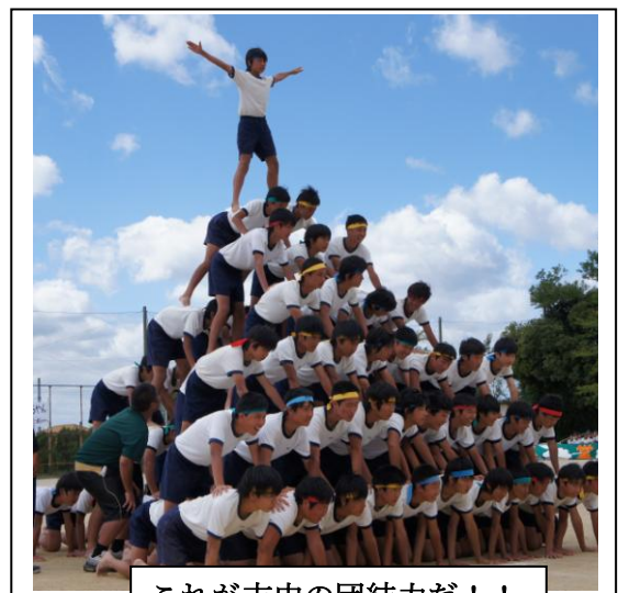
これが吉中の団結力だ！！

学校に目を向けて考えると、「打てば響く」のは小学校低学年です。朝礼や授業の様子から、「おはようございます」と挨拶すると、大きな声で返ってくるのは低学年。授業で、「誰か私の代わりに音読をしたい人？」と言うと、「ハイ！」と言う声があちこちから聞こえるのも低学年。高学年、中学校、高校へと年齢が進むにつれて、反応が減少します。その要因