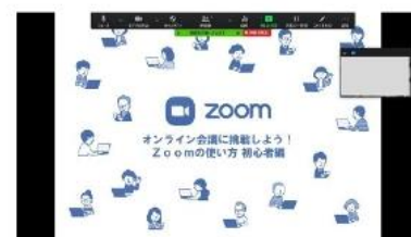
画面の共有イメージ WORD/PPT/WEB画面 など