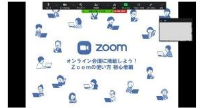
画面の共有イメージ WORD/PPT/WEB画面 など