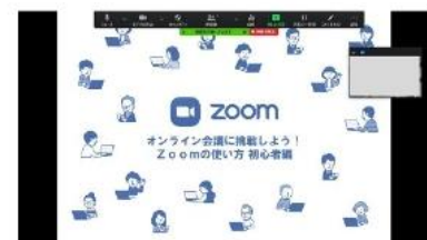
画面の共有イメージ WORD/PPT/WEB画面など