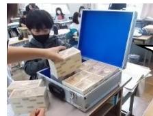
一億円の 模擬紙幣