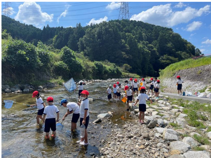
昨年度の余野川での体験活動(生き物調べ)の様子