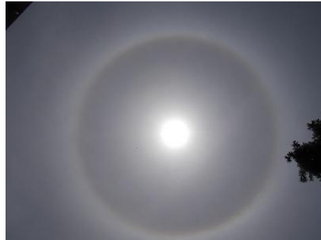
4月23日 校庭より見える日暈

「太陽の周りに虹がかかっている！」その声に思わず運動場に出てみると、太陽の周りに虹色の環が…。日暈(にちうん/英: halo)という大気光学現象だそうです。雲のなかの氷晶がプリズムとなり、通りぬける太陽の光を屈折させてできるそうです。自然科学の力が大きな空のキャンパスに幻想的なアートを描き出