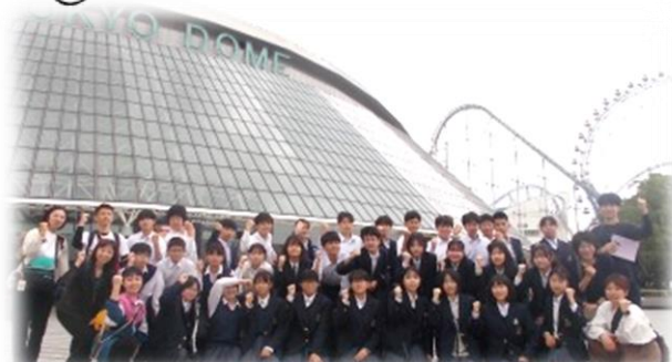
東京ドーム前で全員で記念写真！

9年生にとって思い出の行事となる修学旅行に行ってきました。4年前に見直しを行い、修学の視点を平和学習から未来を意識し世界規模で人権教育を考えるSDGsにシフトして、行先を長崎から首都東京に変更しました。コロナの影響で延期されてから初めての実施でした。コロナの余波に加えて出発一週間前に関東で地震があり、