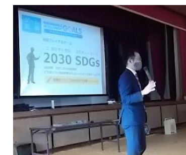
（講師は公式インストラクター）