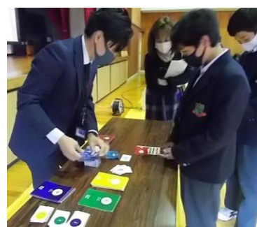
（プロジェクトが達成したら世界状況メーターが変わる）