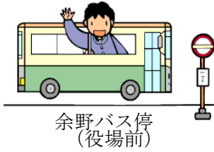
余野バス停 (役場前)