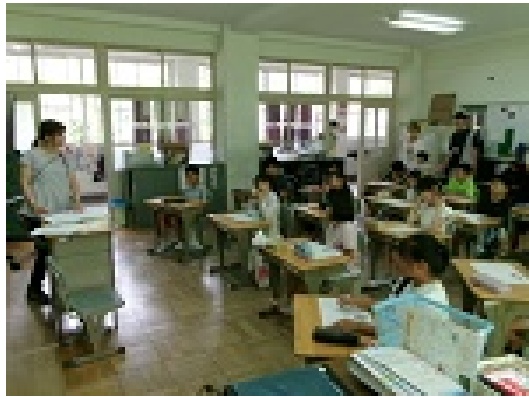
3年 みんなちがってみんないい