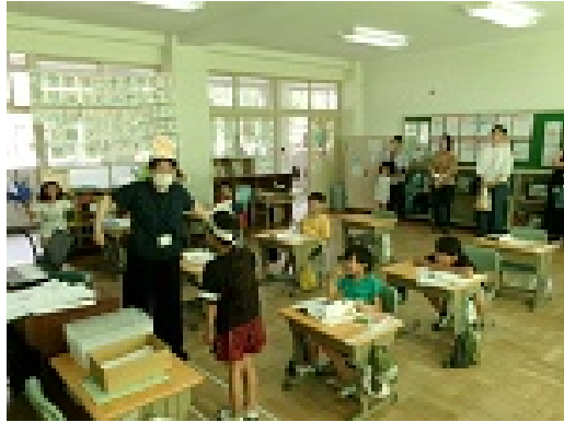
1年 はしのうえのおおかみ