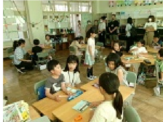
2年 いいところみつけ