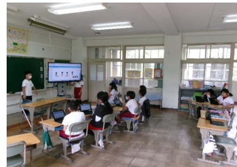
4年：算数 2けたのわり算