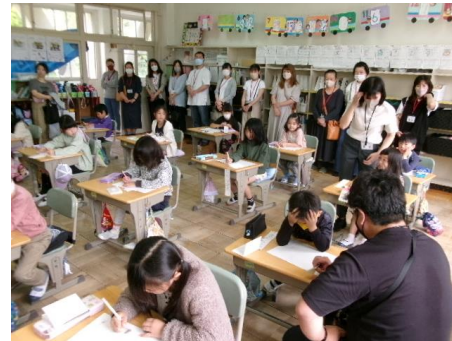
2年：国語 のはらうたの作成と発表