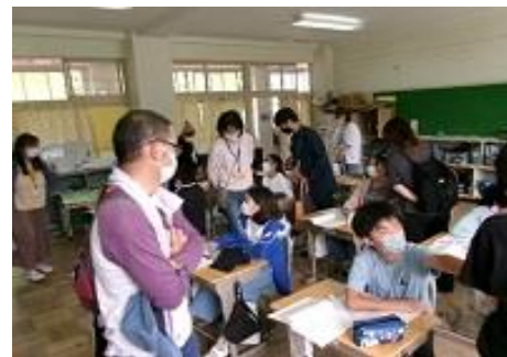
5年：国語 言葉の意味がわかること