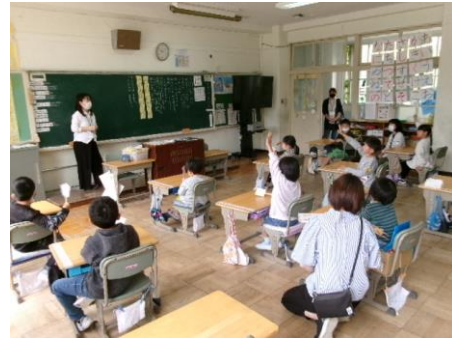
1年：国語 ひらがなの学習

今年度初めての参観となりました。1年生にとっても初めての授業参観でした。保護者が教室におられることで、緊張している様子の子どももいましたが、よく発言してがんばっていましたね。4限にはPTA 実行委員会もありました。お忙しい中、ご参加くださりありがとうございました。