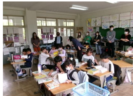
3年：国語 作文「私はだれでしょう？」